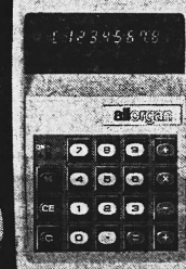
MK 800 Fr. 88.-