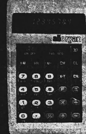
MSR 40 Fr. 260.-