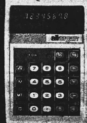
MK 818 Fr. 120.-