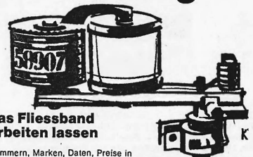
das Fliessband arbeiten lassen

Nummern, Marken, Daten, Preise in einem Anleitgang auf Kästen, Schachteln und vieles mehr drucken. Das vollmechanische KABEY-Anbau-Signiergerät mit einzeln auswechselbaren Typenfüllen als Bestandteil eines Verpackungsbandes einfach mit.