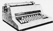
Hermes 700 EL. Die perfekte elektrische Schreibmaschine für die Sekretärin. Jetzt noch perfekter, mit eingebauter Korrekturtaste.

Ein sehr guter Grund mehr, eine der vielseitigen, komfortablen und vor allem unerhört robusten und dauerhaften Hermes-Schreibmaschinen anzuschaffen. Schweizer-Qualität ist wieder Trumpf. Wollen Sie mehr wissen? Schicken Sie uns den Coupon.