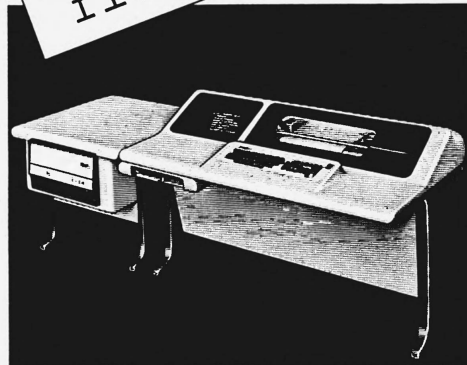
RUF-DIALOG für Datenerfassung und Datenabfrage am Arbeitsplatz, on-line zum Computer