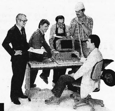
Publicitas Heiden PPH

Interessenten melden sich bitte unter Chiffre 37-W-85849 bei Publicitas, Postfach, 4501 Solothurn.