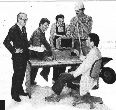
Publica Press Medien PPH