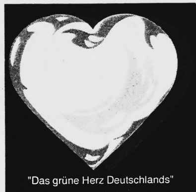
"Das grüne Herz Deutschlands"

Hinterlegungsdatum: 6. August 1991 389515 Bernhard A. Schaub , Kirchfeldweg 8, 5036 Oberentfelden