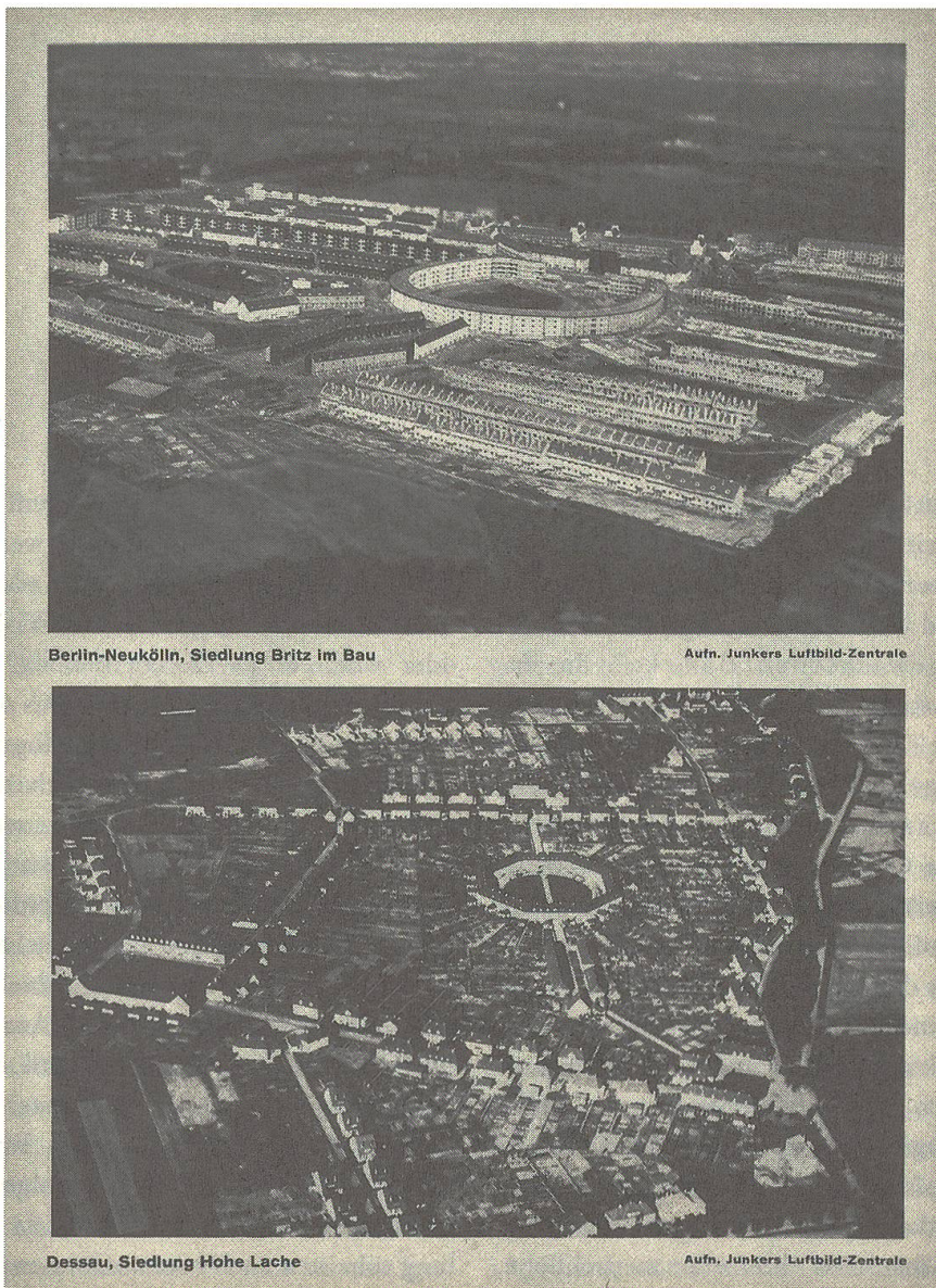
Berlin-Neukölln, Siedlung Britz im Bau und Siedlung Hohe Lache, Dessau, in: Karl H. Brunner, Weisungen der Vogelschau. Flugbilder aus Deutschland und Österreich und ihre Lehren für Kultur, Siedlung und Städtebau, München: Georg D. W. Callwey 1928, S. 73

Der Blick von oben reicht aus, um sich in solche umfassende Argumentation zu begeben. Die Bilder kommentierend beschränkt sich Brunner auf Architektonisches – allerdings ohne auf die hohen Ansprüche zu verzichten. Flugaufnahmen Wiens sind ihm Anlass, im Kapitel “Städtebau” deren Bedeutung als “Universalwissenschaft” festzustellen oder eben zu fordern. Das Bild enthüllt ihm diesbezüglich Abweichungen von den ersehnten regelmässigen und ‘bildhaften’ Gestaltungen: “In Hinsicht auf den unserer Epoche unmit-