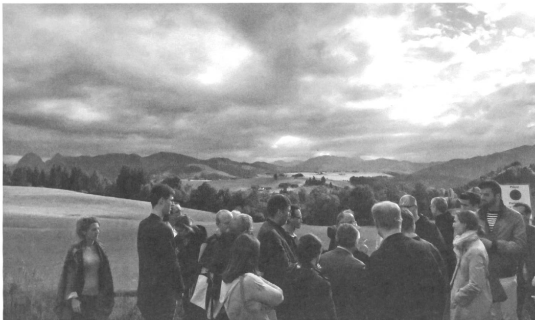
Exkursion, bei der Meinradskapelle auf dem Etzel, SZ, Barocksommerkurs 2015

Bautätigkeit und die Prachtentfaltung von Papst Paul V. vor, die der Öffentlichkeit nach der Kritik an übermässiger Pracht durch das Tridentinum nun in Form einer „Magnificenza religiosa“ vorgestellt wurde. Wie sie zeigen konnte, griff der Papst bei den Darstellungen seiner Bauten auf antikisierenden Baumünzen oder bei der Allegorie der Magnificentia als Frau, der eine Pyramide beigegeben ist, auf antike Vorbilder zurück; entsprechend wurde Paul V. in der Panegyrik mit Kaiser Augustus verglichen.