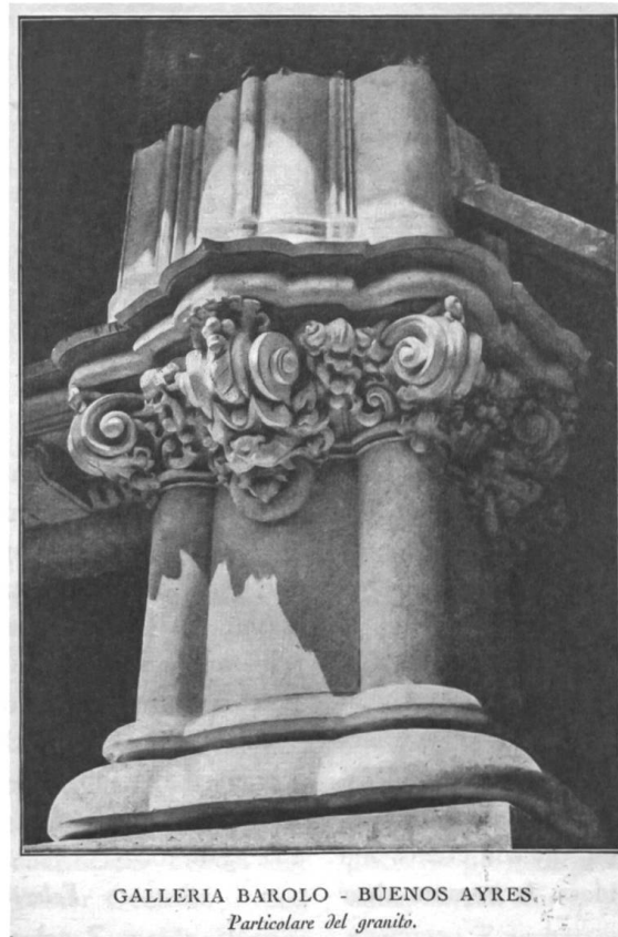
GALLERIA BAROLO - BUENOS AYRES. Particolare del granito.