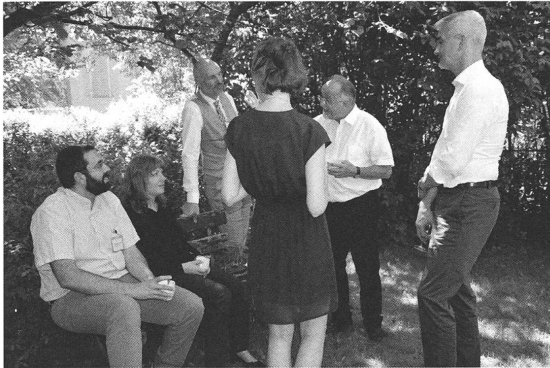
Pause im Garten, Barocksommerkurs 2019