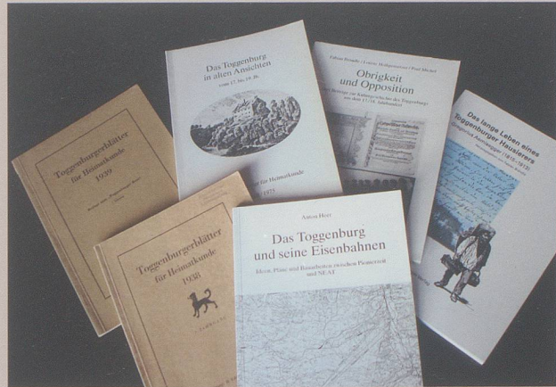
Toggenburger Blätter für Heimatkunde im Wandel