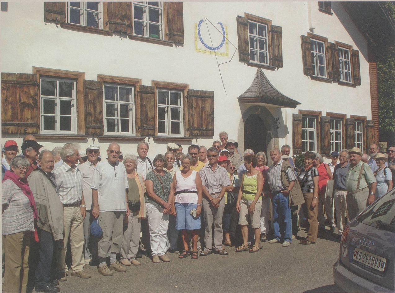
Dem restaurierten Haus Häberli am Ackerhausweg galt unser Besuch beim Rundgang um Ebnat Kappel im August 2007.

In der Stiftung St.Galler Kulturgut gehört die Toggenburger Vereinigung zu den Stiftungsgründern.