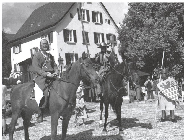
2. Sarganser Mittelaltertag, 21. Mai 2011.

Neben diesen Schwerpunkten im Jahresprogramm hat der Historische Verein Sarganserland seine Kraft weiterhin auf die Mithilfe zur Fertigstellung der Rechtsquellen Sarganserland gelegt; sie werden 2013 erscheinen. Auch das Projekt der «historischen Glasnegative» sowie der neuen Multivision im Museum Sarganserland wurden vorangetrieben. Das Programm und die Aktivitäten 2011 waren arbeitsreich, gleichzeitig fanden sie aber auch gute Beachtung. Das ist wohl der schönste Lohn für die historische Arbeit.