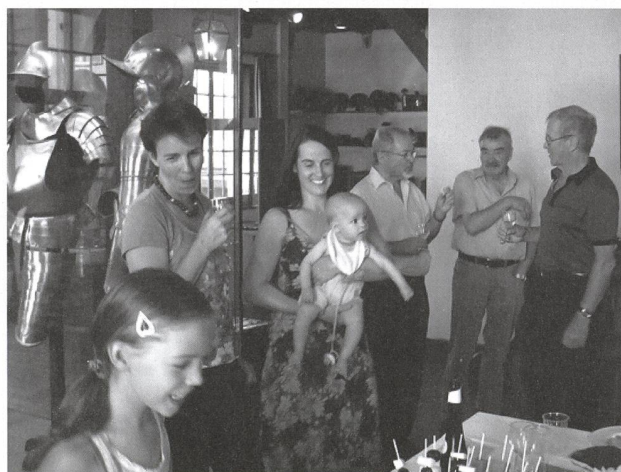
Szene aus einem der zahlreichen, beliebten Apéros im Wappensaal des Museums.