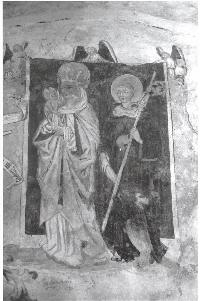
Fresko aus der mittelalterlichen Michaelskapelle unter dem Chor der Bregenzer Pfarrkirche St. Gallus. Neben der Madonna ist der heilige Gallus als bartloser junger Mönch dargestellt.

Die Exkursion vom 1. Oktober 2011 stand unter dem Titel 1400 Jahre Kolumban und Gallus in Bregenz . Dr. Karl