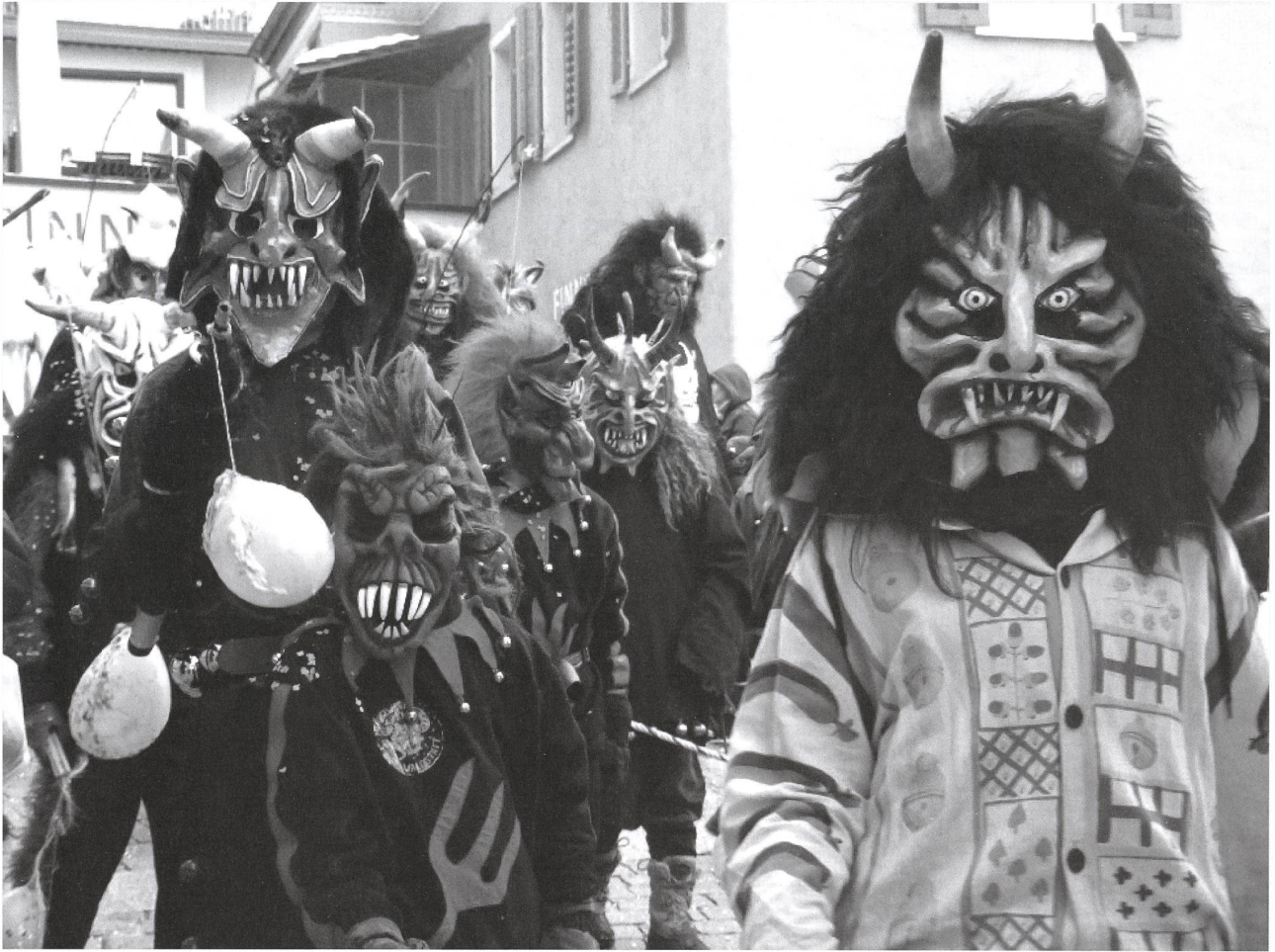
Die Wiler Fastnachtsfigur schlechthin ist der Tüfel. Das weisse Tüfelsgewand (rechts) wurde nach einem authentisch bemalten Original aus Wil, datiert von Anfang 19. Jh., nachgebildet, das sich im Schweiz. Landesmuseum befindet. Es wird von der 1993 gegründeten Wiler Tüfelsgilde getragen. Die Masken werden von ihren Trägern selbst angefertigt.

aus dem Inhaltsverzeichnis: der Ursprung des Narrentreibens im alemannischen Raum; die verschiedenen Begriffe der Fastnacht; die Gründung der FGW; der Bürgertrunk; die Wiler Fastnachtsfiguren; die Fastnachtsumzüge; Guggenmusiken; Masken- und Kostümbälle; Fastnachtsdekorationen in den Wirtschaften; Schnitzelbänke; der Aschermittwoch; Hirs Montag in Rossrüti. Mitautoren dieses Buches sind die beiden Vorstandsmitglieder Benno Ruckstuhl und Werner Warth. Da diese Schrift ein interessantes Kapitel Wiler Geschichte darstellt, fand sie der Vorstand als Jahresgabe für unsere Mitglieder geeignet. Mit dem Erwerb von 400 Exemplaren durch die Kunst- und Museumsfreunde erfährt die Publikation eine namhafte Unterstützung.