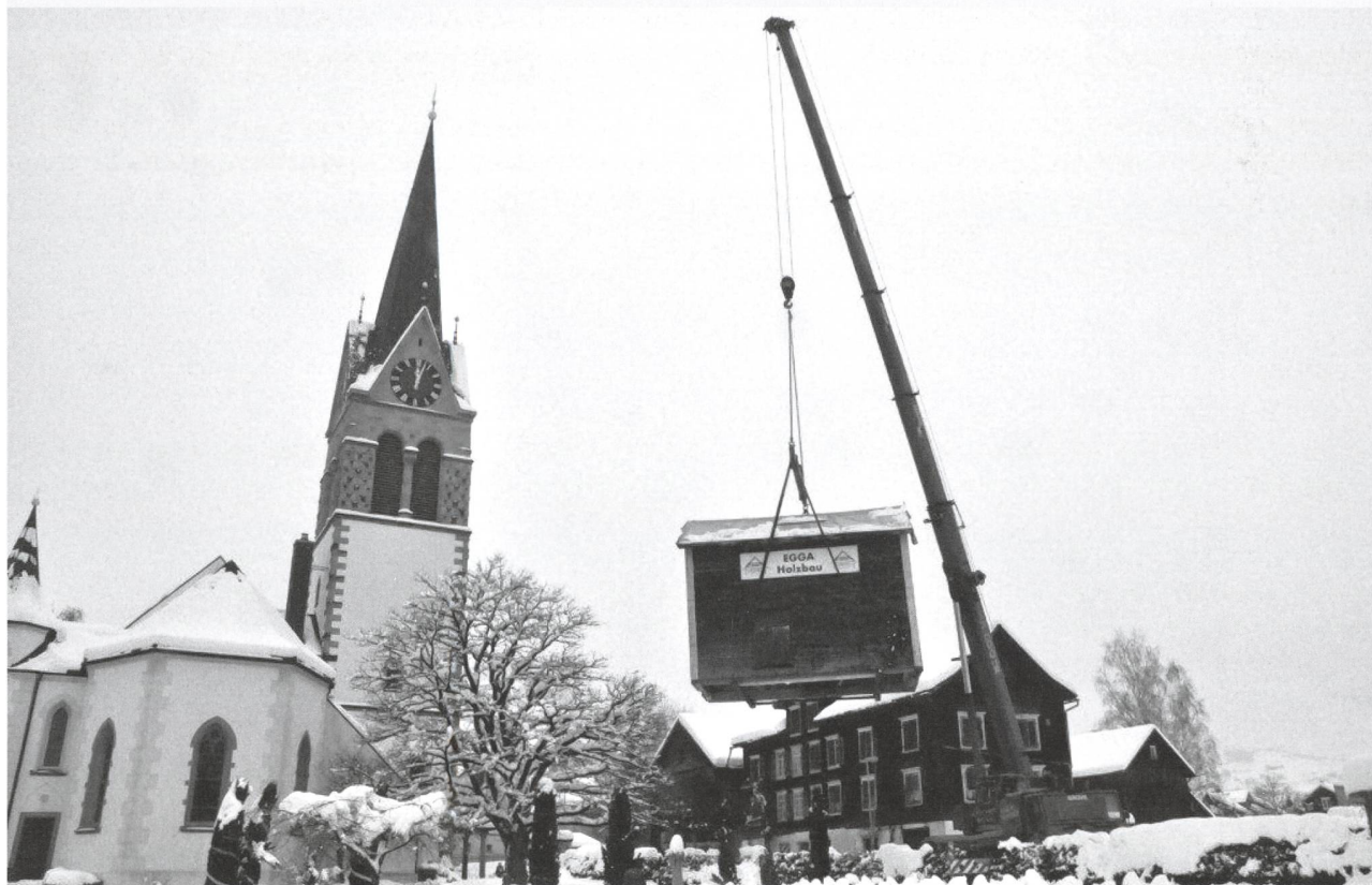
21. Dezember 2011: Die Messerschmiede wird gezügelt.

Am 12. September begann diese Realität formell in einer kleinen Feierstunde mit dem symbolischen ersten Spatenstich, der in diesem Fall ein gemeinsames Ziehen aller beteiligten Vereine, Behörden und Gremien am gleichen Strick war. Inzwischen ist die neue Heimat der Messerschmiede bereit und am 21. Dezember erfolgte die «Züglete» unter grosser Anteilnahme der Presse und der Bevölkerung.