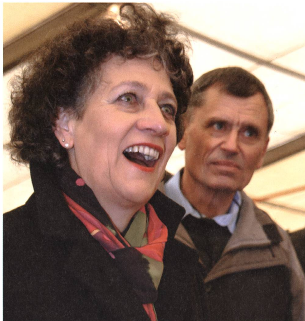
Regierungsrätin Kathrin Hilber. Schnappschuss beim Grabungsbesuch in Weesen, Rosengärten, im März 2007.

Seit März beschäftigen sich Erwin Rigert und Roman Meyer intensiv mit der archivfertigen Ausarbeitung der Dokumentation, der Aufarbeitung der Pläne sowie dem Schlussbericht. Diese Arbeiten wurden durch weitere Feldeinsätze in der Altstadt (Schwertgasse, Schwertgas-