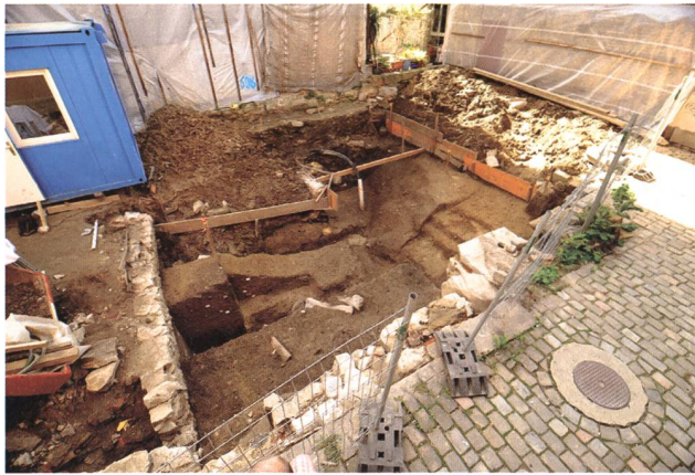
St. Gallen, Schwertgasse 15. Blick auf den ehemaligen Hinterhofbereich und den teilweise ausgenommenen Graben.