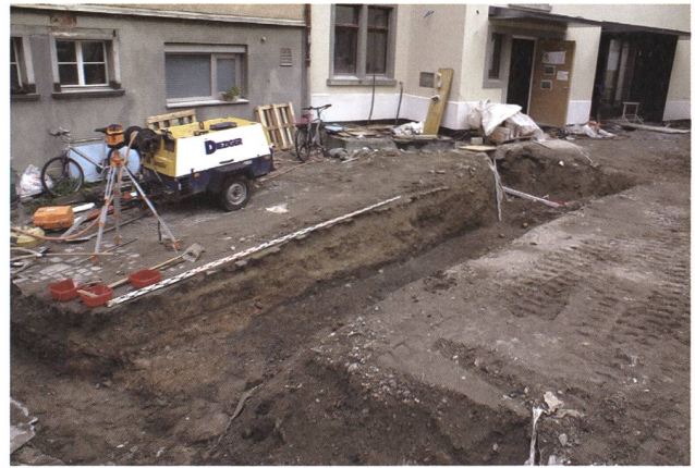
St. Gallen, St. Katharinen. Blick auf den neuen, in archäologische Schichten eingetieften Fundamentgraben. Gut sichtbar der mittelalterliche rötliche Brand- und Abbruchschutt.

sprachen verzögerte sich das Bauprojekt bis 2012. Die Kantonsarchäologie wurde erst kurz vor Baubeginn informiert, obwohl die 2008 erteilte Baubewilligung bereits auf die notwendige archäologische Untersuchung hingewiesen hatte. Die Ausgrabung, die vom 23. Juli bis 28. September dauerte, leitete Dr. Steffen Knöpke.