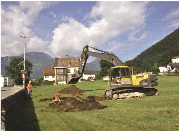
Weesen, Staad. Baggersondagen im August, Blick gegen Westen.

Die wenig überbaute Flur «Staad» liegt im Nordosten des Städtchens Alt-Weesen auf dem Schuttkegel des Spittelbachs. Eine geplante Überbauung machte archäologische Sondierungen nötig. Die Arbeiten wurden durch ProSpect GmbH als Mandat durchgeführt. Ganz im Süden des Areals liegen Reste der mittelalterlichen, 1388 zerstörten Stadt Alt-Weesen und der 3,5 m tiefe Stadtgraben, der noch bis ins 20. Jahrhundert sichtbar war. Vom nördlichen Bereich gab es dagegen keinerlei archäologische Informationen. Hier wurden in der Folge 16 Suchschnitte geöffnet. Diese wurden in den mächtigen Überdeckungen des Spittelbachs bis zu 3,5 m tief ausgehoben. Bis auf ein undatiertes Mauerfundament wurden im nördlichen Bereich keine archäologischen Strukturen gefasst. Eingela-