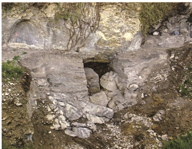
Oberriet, Unterkoebel. Nach Abschluss der Grabungen im Juni 2012.

bio Wegmüller). Dadurch konnte ein repräsentativer Ausschnitt der 2011 von Spallo Kolb entdeckten Fundstelle ausgegraben und offene Fragen zur Ausdehnung der Fundschichten geklärt werden. Nach Abschluss der Aus-