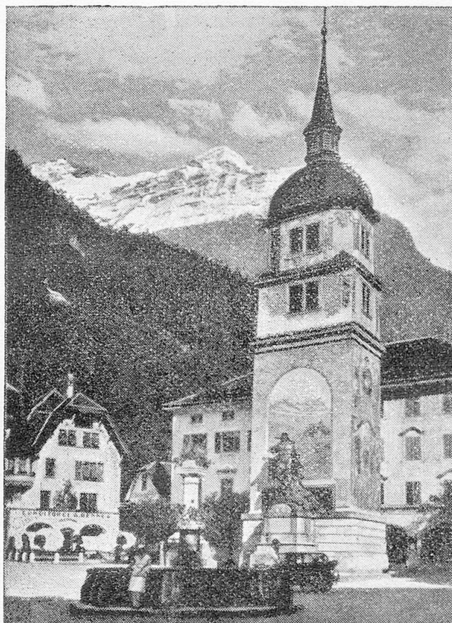
Altdorf mit Telldenkmal, Hoher Faulen und Belmeten

So reich die Zahl urnerischer Kriegs- und Staatsmänner in alter und neuer Zeit geschichtlich belegt ist; an Künstlern wie Bildhauer, Maler und besonders Musiker hat das Land nicht viele hervorgebracht. Der uns bekannteste Urner Musiker ist der durch seinen unvergänglichen Schweizerpsalm berühmt gewordene Pater Albrik Zwyszig von Bauen. Aber nur Eingeweiht-