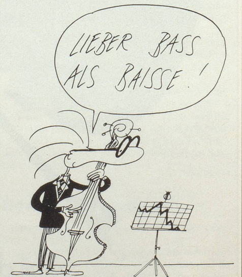
Cartoon aus der «Weltwoche».