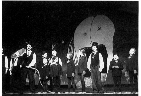
Szene aus dem Märchen «D'Horchhäxe»: die Hexen sammeln Töne.