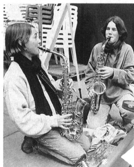
Junge Instrumentalisten – Orchestermitglieder und Konzertbesucher der Zukunft. Foto: Madelaine Legler, Meilen Jeunes instrumentalistes: membres des orchestres et publique dans les concerts de demain.

L'un des concerts a eu lieu dans les salles d'un musée d'art, où les cuivres ont été priés de ne pas «forcer» pour éviter les dégâts. Les participants ont par ailleurs eu l'occasion d'assister à des répétitions au Metropolitan Opera où jouait l'Orchestre philharmonique de New York.