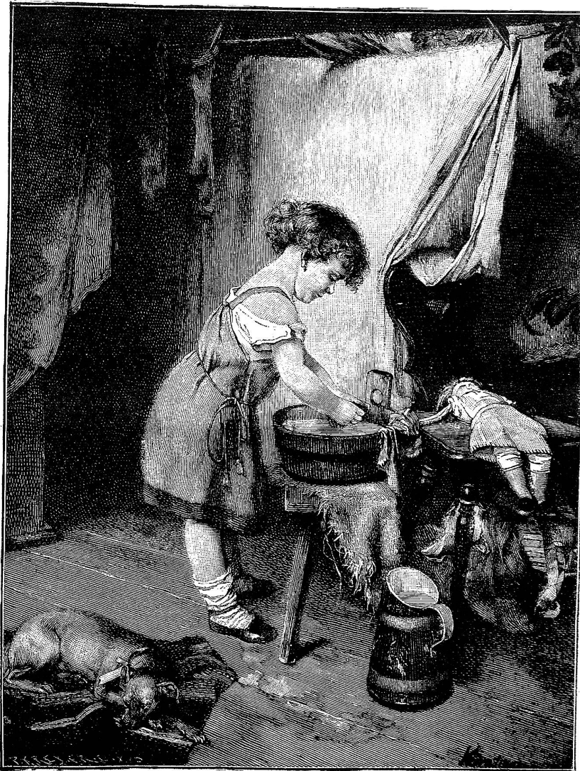
Geschäftiger Eifer eines jungen Mädchens.

„Vergib, Fernand, und sieh' her!“ ruft sie mit vor Bewegung zitternder Stimme, indem sie die Krepphaube lüftet. „Mein Haar ist vor der Zeit gebleicht; die Natur selbst hat