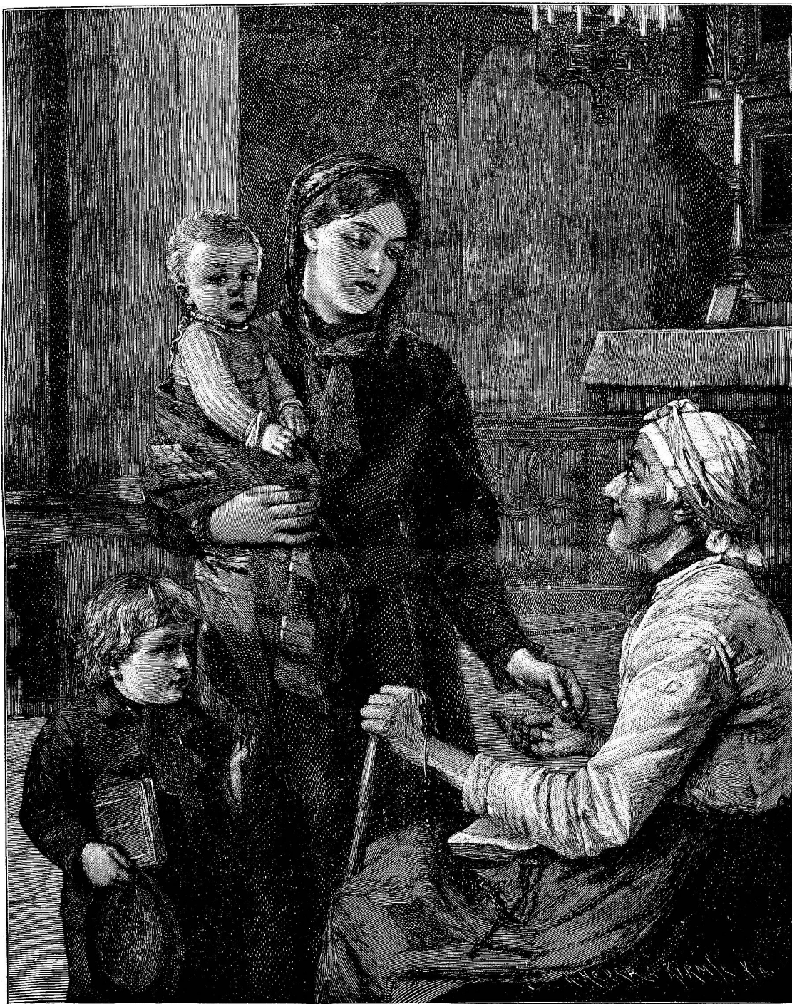
Das Schärlein der Witwe.

der Hand, wo er bei der Priesterweihe mit dem hl. Oele gesalbt worden war, völlig heil blieb; sonst bricht die schreckliche Krankheit gewöhnlich an den Händen, wie an Kopf und Füßen zuerst aus. Am 15. April 1889 verließ seine Seele den Leib, den er als ein wahrer Priester Gottes in Liebe für das Heil