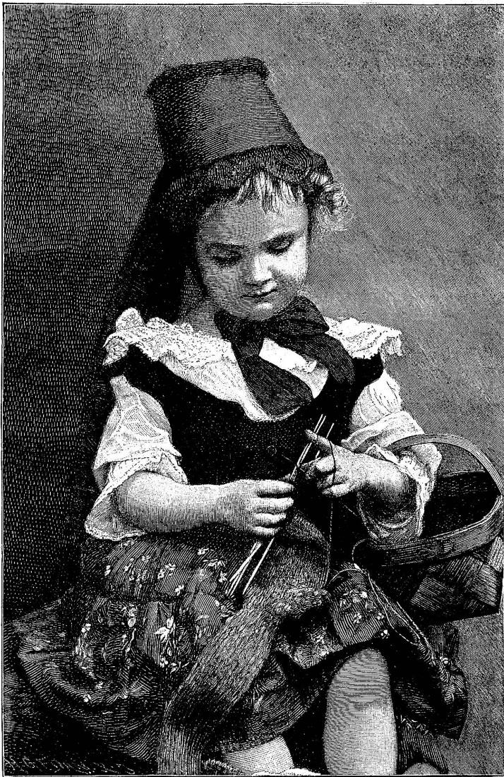
Das kleine Hausmütterlein.