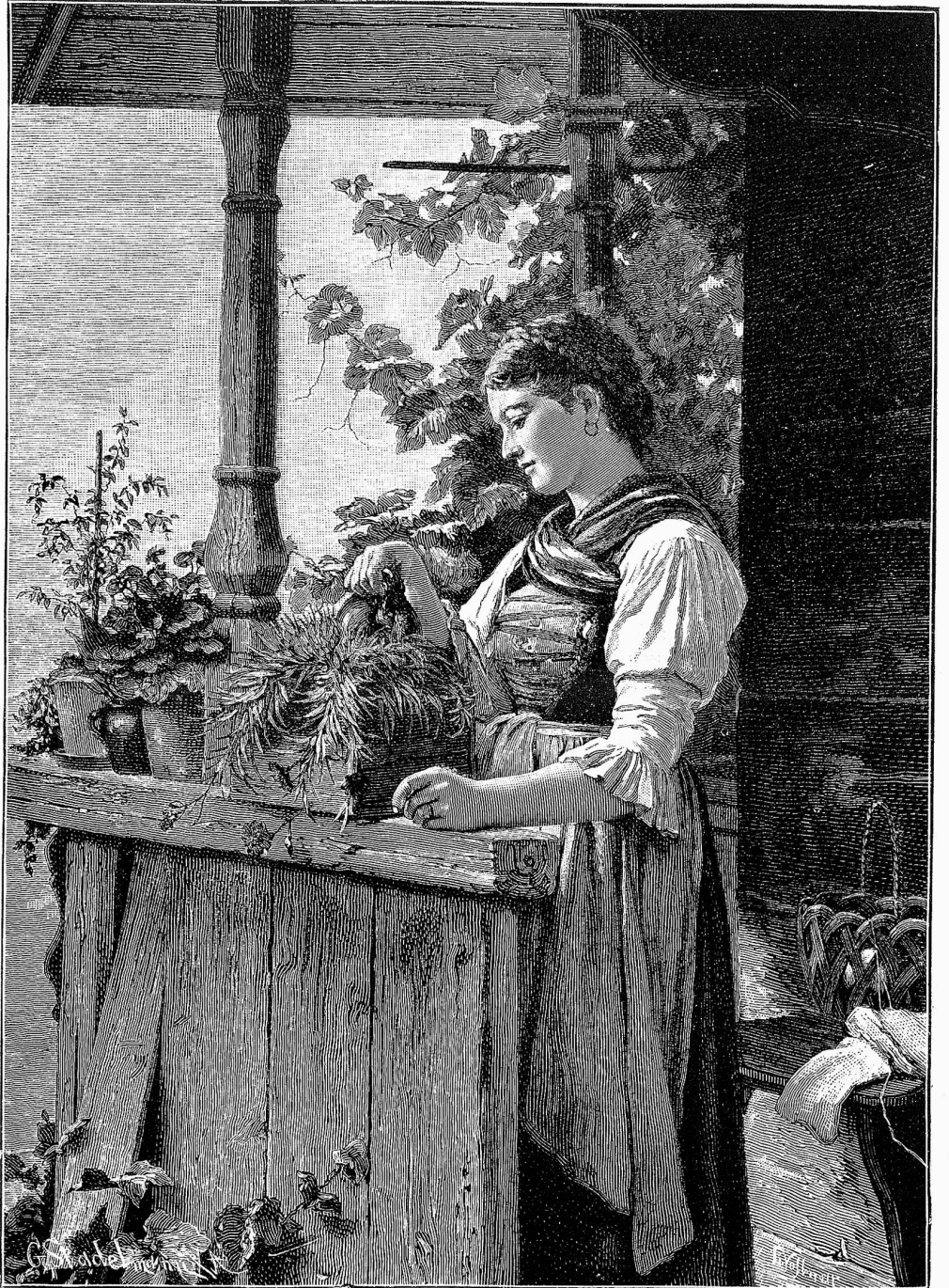
Des Haldenbauers Töchterlein.

Trude glaubte überdies noch wahrzunehmen, daß die Glück