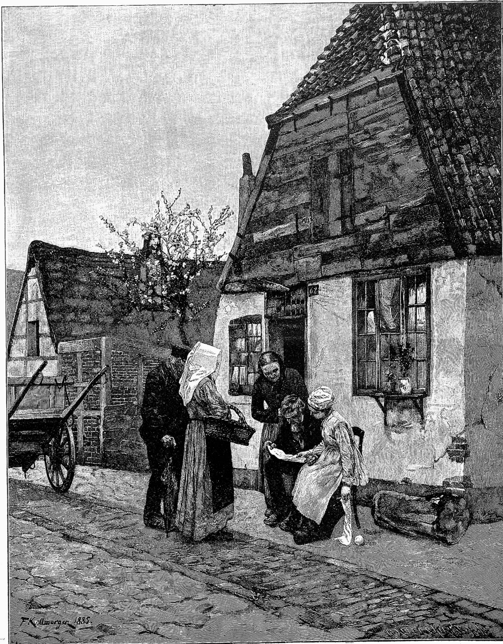
Der Brief aus Amerika.

Die unglückliche Glücksmaus aber geriet beim Eintritt des heftig auftretenden Baurates zwischen Thüre und Angel, ein Umstand, welchem Trude die aller-