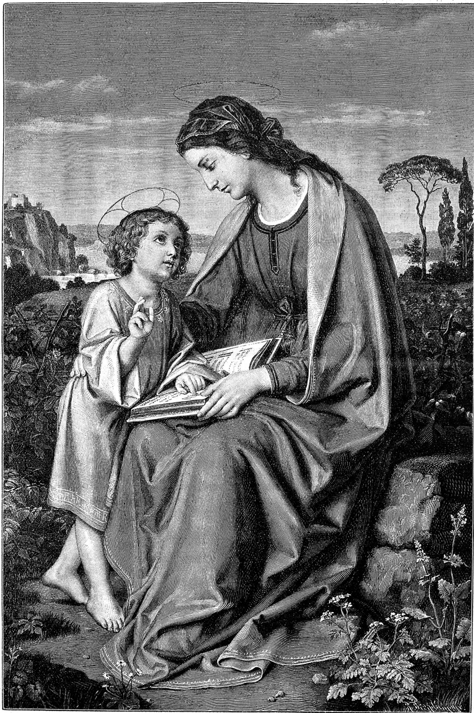
Ein göttliches Kind und eine göttliche Mutter.

Mit dieser klugen Auseinandersetzung des gütigen Pfarrers war die heikle Frage unter den Gaudörflern denn auch abgethan. Sie thaten dem alten Fräulein den Gefallen, ihr Bauernhaus „das Schloßchen“ zu nennen und ihr mit dem Re-