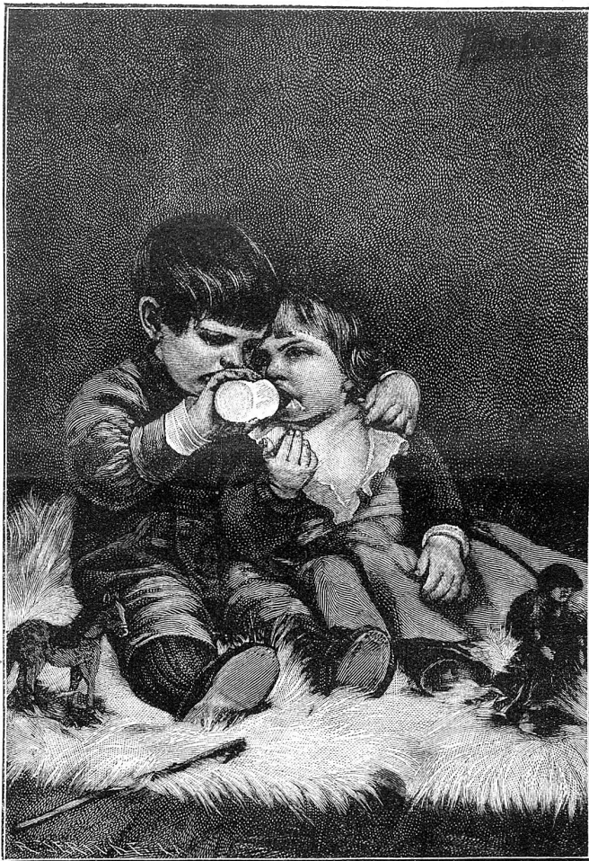
Aus der Kinderstube (Abb. 2).