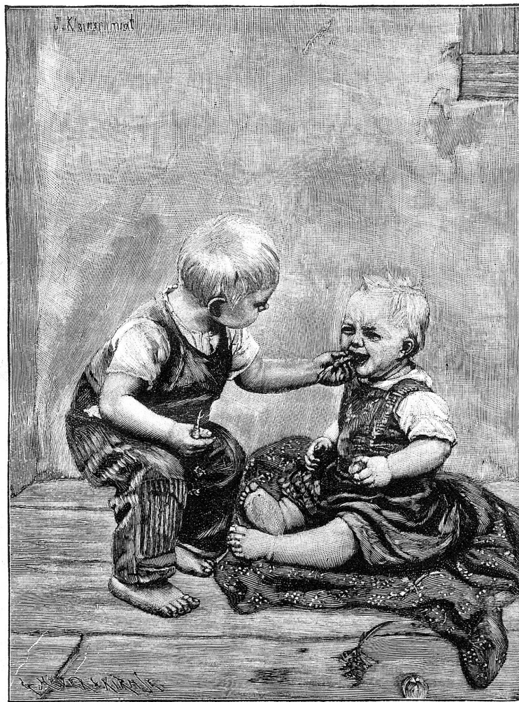
Aus der Kinderstube (Abb. 1).

„Leben Sie wohl, gnädige Frau! sagt der Künstler, und