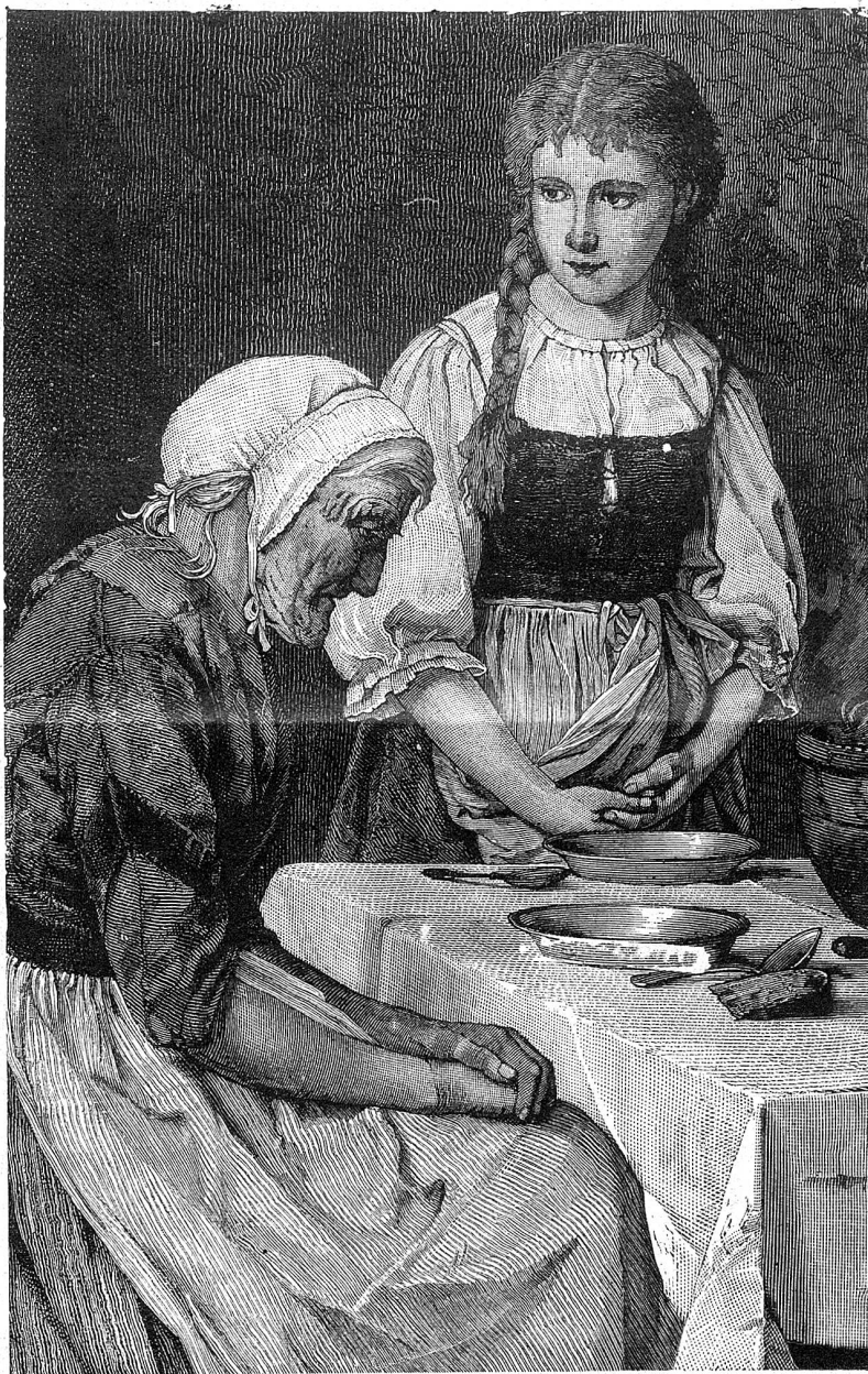
Gib uns heute unser tägliches Brot.