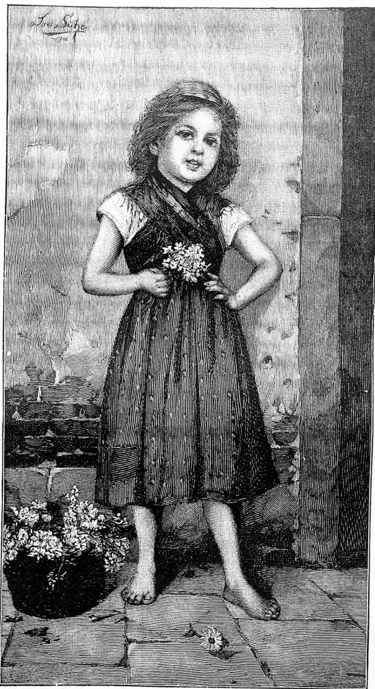
Ein Kind des Südens.

„Geh jetzt zur Maman und sag es ihr schön“, mahnte die Krankenwärterin, denn sie sah, wie Schwester Alma sich