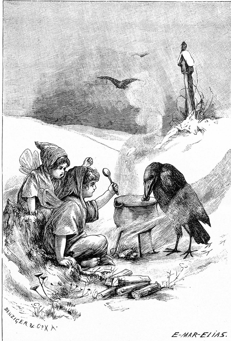
Elfen und Rabe.

Mechanisch grüßte er; mechanisch ging er den Weg nach Hause, hoffend gegen alle Hoffnung. Aber Elisabeth war nicht heimgekehrt. Der Wirbelsturm der Wut, der jäh über sein Herz brach, ließ den Vertrauensbau, den Jahre innigster Vereinnung erhoben, jämmerlich zusammensinken. Der Wildbach des Zweifels verwüstete eine makellose Vergangenheit, und das Bild der geliebten Frau riß entzwei wie der Vorhang im Tempel.