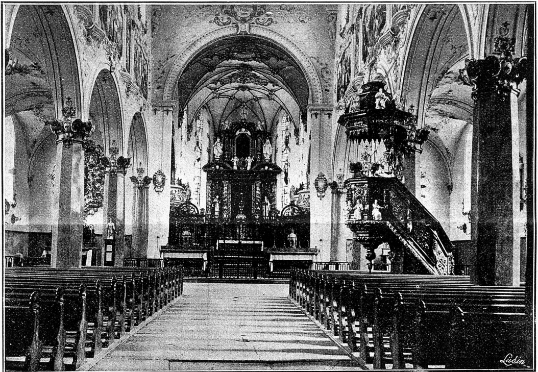
Maria Stein: Inneres der Wallfahrtskirche.

Die Calendula sollte in keinem Hause fehlen. Sie ersetzt das Sublimat, das Karbol, das Lyso und wie alle die giftigen