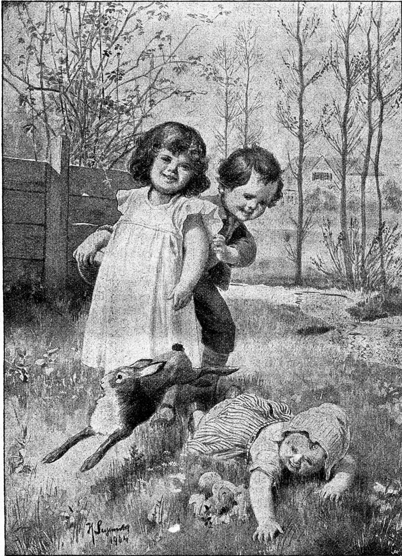
Der Osterhase. Von S. Sujemihl.

Die Kinder werden auch in ihrer Bekleidung viel zu oft als Spielzeug und viel zu selten als moralische Aufgabe behandelt. Amor und Psyche flattern bei kühlen Sommertagen dürftig bekleidet und halbnackt am Tage herum und des Nachts wundert sich die Mutter, wo das gesunde Geschöpf einen so schweren Husten geholt. Ueberhaupt kann man einer jeden Mutter nicht genug anempfehlen, doch eine heilige Wachsamkeit über die Gesundheit ihrer Kinder zu haben. Man hat, ob reich oder arm, zu allem Zeit, was man wirklich will. Wer der wohlhabenden Mutter zeigte, daß die persönliche Wartung ihres Kindes ihr edelstes Geschäft ist, und die arme Mutter lehrte, daß sie dabei am allermeisten verdient, der wäre ein großer Kinderarzt.“ — So weit einer der tüchtigsten Ärzte und edelsten Menschen, die je gelebt und zum Wohle der leidenden Menschheit unendlich viel getan hat. r.