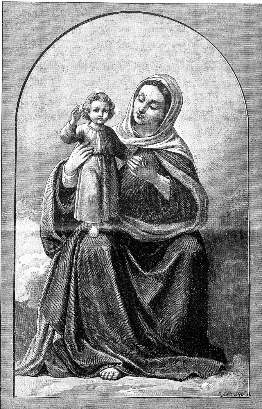
Unsere Fürsprecherin (Madonna mit dem Jesuskinde).

Manche sind wieder gleichgültig. Sie vergessen, daß das Dienstmädchen nicht nur Arme und Füße hat zum arbeiten, sondern auch ein fühlendes Herz. Wie soll es den Herrschaften