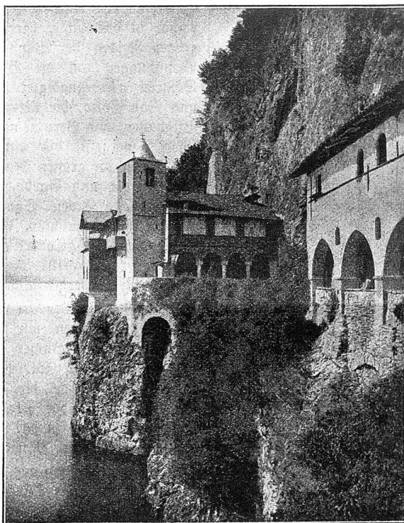
Santa Caterina am Lago Maggiore.

Die resolute Frau Mutter wußte vorerst nicht recht, ob sie wache oder träume; so sonderbar kam ihr die ganze Szene vor. Als aber der flaumbärtige Jüngling, der als Offizier der großen Nation offenbar sehr von seiner Würde überzeugt war, sie mit vernichtenden Blicken betrachtete, da gewann der