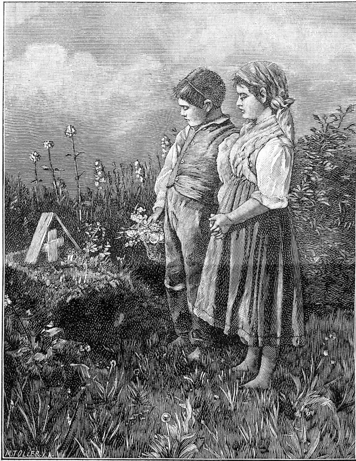
Ein Muttergrab, ein heilig Grab. Von Streitenfeld.

Wie alltäglich nahm das junge Ehepaar das Frühstück wieder auf dem Balkon ein. Auf einem Stühlchen saß das Waisenkind neben dem Sitz seiner Gönnerin. Die Stunde der Entscheidung war da. Sollte Helenchen von jetzt ab einer lichten, freund-