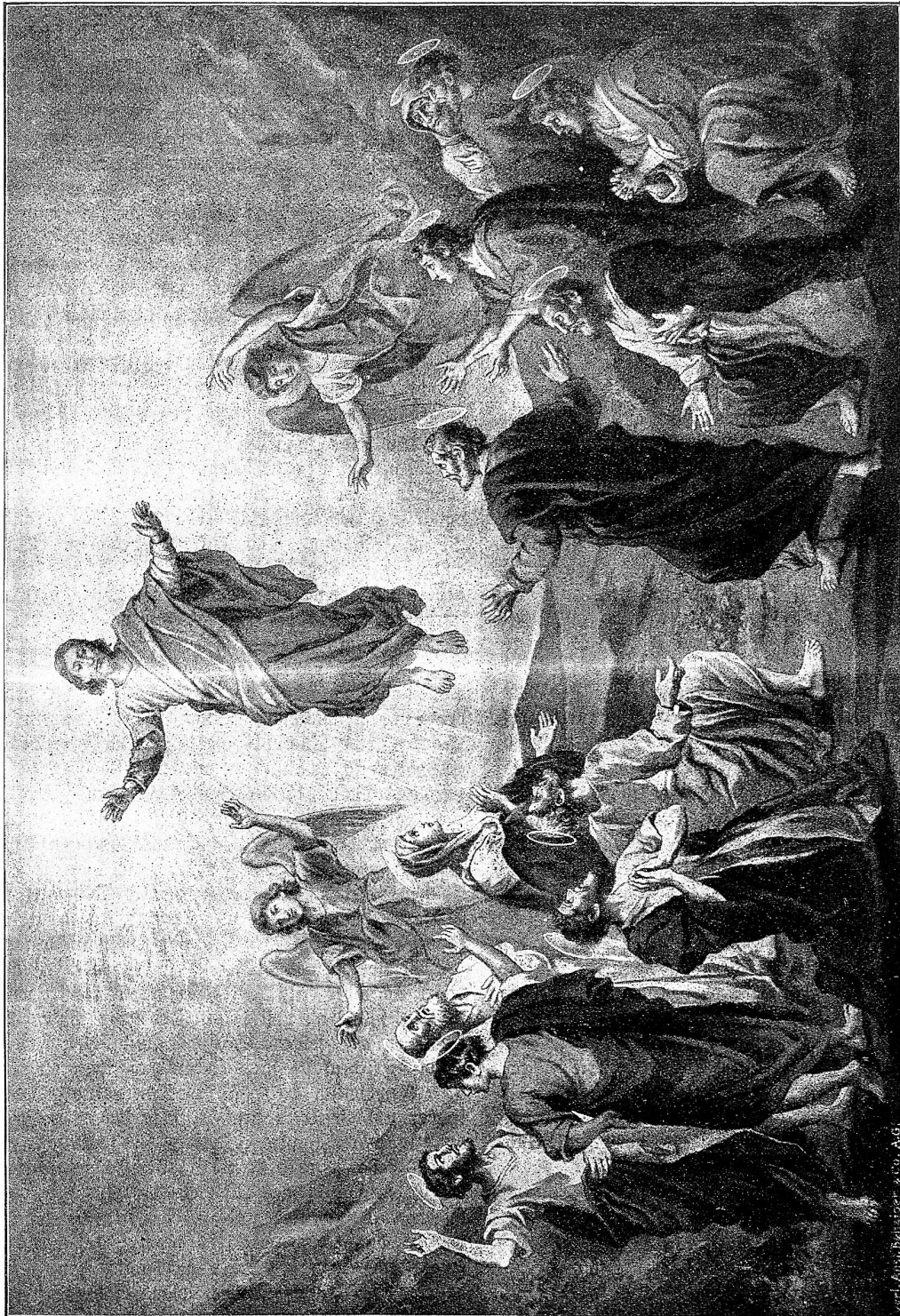
Sinnesfahrt Christi. Nach dem Gemälde von Offenberger.

aufs äußerste geprüft werden, so daß ihr kein anderes Mittel zur Rettung bliebe, dann: „Ein Sprung von dieser Brücke macht mich frei!“ Gertrud Stauffacher will eher sterben, als