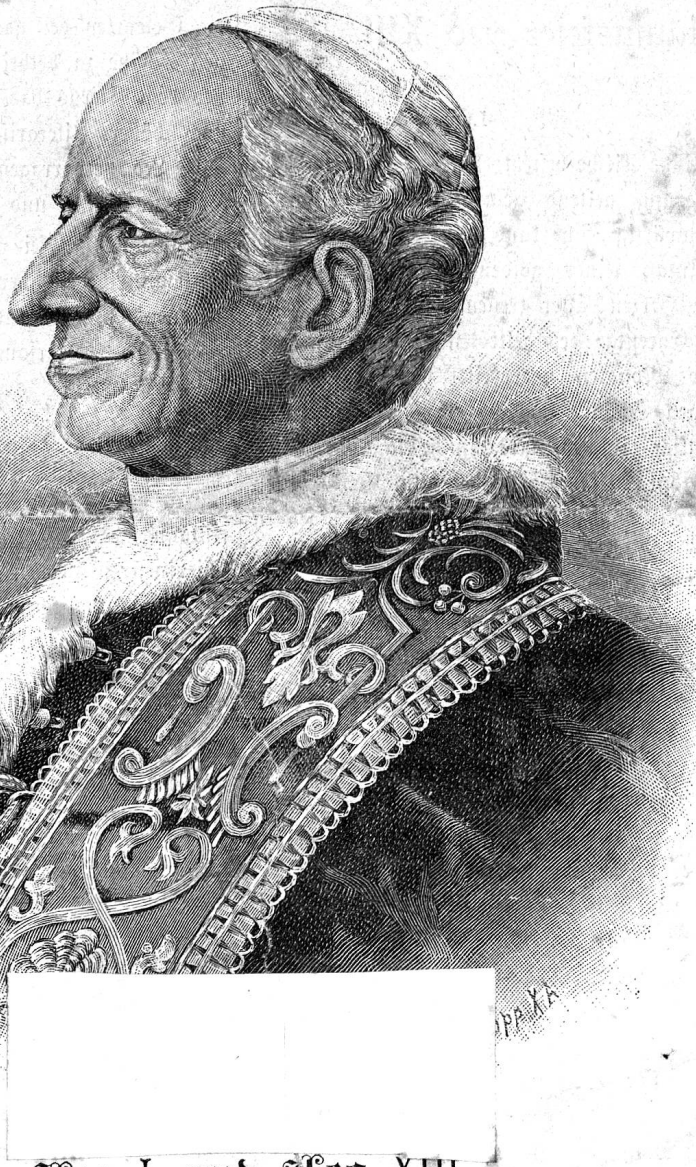
Leo I. und Leo XIII.

Einrückungsgebühr: 10 Cts. die Perizeile oder deren Raum, (8 Pfg. für Deutschland) Erscheint jeden Samstag 1 Bogen stark m. monatl. Beilage des „Schweiz. Pastoralblattes.“ Briefe und Gelder franko