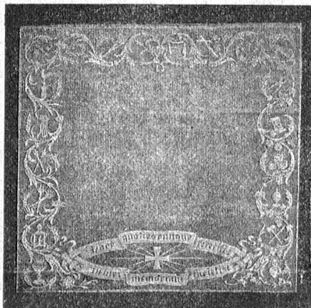
Dessin No. 533 zu