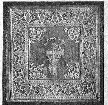
Dessin No. 452 zu

in reichhaltiger Auswahl mit verschiedenen eingewebten oder handgestickten Dessins von Fr. 1.30 an.