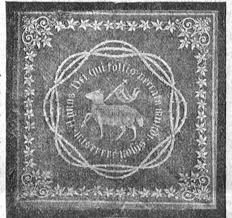
Dessin No. 453 zu

Dasselbe mit der ganzen Passion Jesu Christi in der Bordüre eingewebt, hat vor allen andern den Vorzug, dass es in der Mitte keine Symbole enthält, sondern glatt ist. In Bezug auf Ausführung steht es unerreicht da.