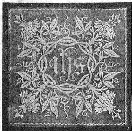
Dessin No. 410 zu

48 □ cm. per Dutz. Fr. 34. — = M. 27.20 stückweise » 2.90 = » 2.30