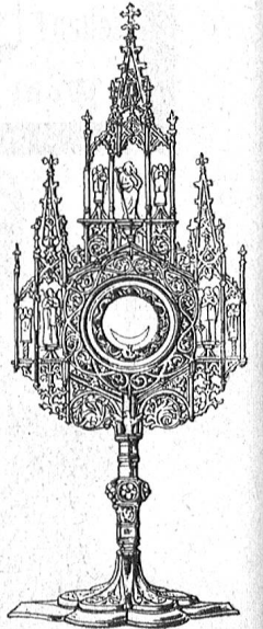
Nr. 101. Gothische Monstranz aus Bronze vergoldet mit 5 versilberten Sta- tuetten, 65 cm. hoch. Fr. 335.

Die Versendung der Waaren erfolgt ab Einsiedeln.