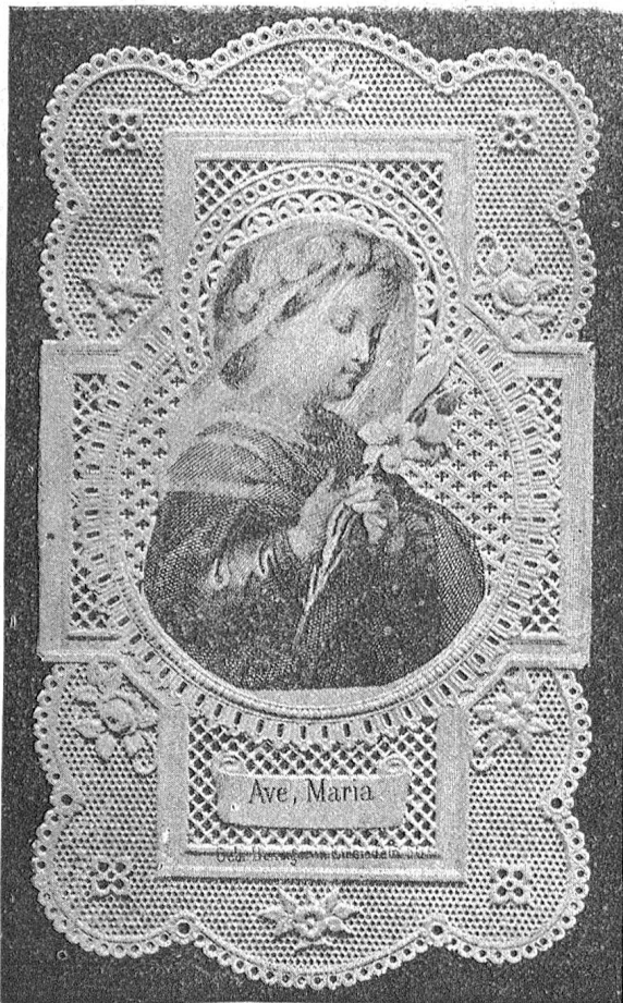
Abbildung eines Stahlstiches. Nr. 5200 E.R.

Benziger & Co. Déposé. Einsiedeln, Schwyz.