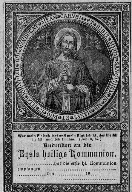
Verkleinerte typogr. Abbildung von No. 13564.

Wir bitten, Muster und Special-Katalog zu verlangen!