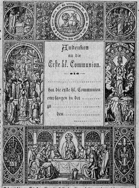
Verkleinerte typogr. Abbildung von No. 13565.

mit reichem Bilderschmuck und zierlicher Ornamentierung in Gold- und Farbendruck, ein prachtvolles Blatt, 28 cm hoch und 20,7 cm breit. Die reiche Einfassung des Mittelstückes für die Gedächtnis über den Empfang der ersten hl. Communion setzt sich also zusammen: Die untere Randleiste zeigt als Hauptbild die Einsetzung des hl. Abendmahles mit der Unterschrift: „Nehmet hin und esset“ etc. Auf der rechten Randleiste wird die Spendung der ersten hl. Communion dargestellt mit der Inschrift: „Der Leib unseres Herrn“ etc., während auf der linken das hl. Sacrament als Brod der Engel in einer Monstranz zur Anbetung durch die Engelschaaren erhoben wird, und der Born des Lebens und die Gnadenquelle versimmbildet werden. Die Kopfleiste endlich zeigt im Mittelstück das hl. Omerlamn mit der Rundschrift: „O Du Gamm Gottes“, etc. und in den Seitentheilen in reicher figürlicher Gruppierung biblische Vorbilder, das Opfer Melchisedechs, das Manna in der Wüste. Sammtliche Darstellungen sind in reicher und passender symbolischer Ornamentierung verziert.