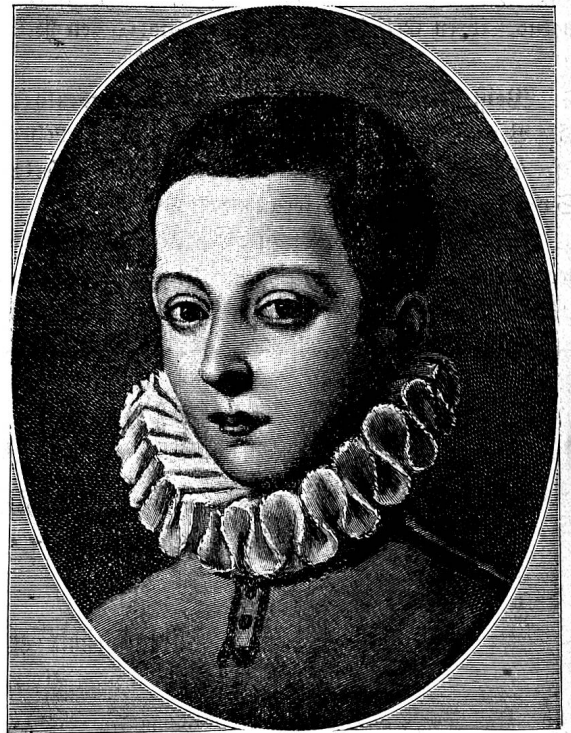
Der hl. Aloysius im Alter von 14 Jahren.