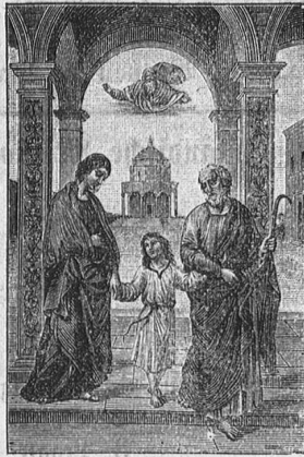
Verk. Abbildung des Choro-Tiefbildes.