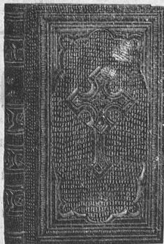
Einband No. 302.

Die „Blüten“ und „Glöcklein“ haben nichts von ihrem Duft eingebüßt und werden auch im kommenden März- und Mai-Monat die Verehrer und Verehrerinnen des hl. Joseph und der himmlischen Maikönigin wieder erquickten. Solothurn, „Schweizer Kirchenzeitung.“