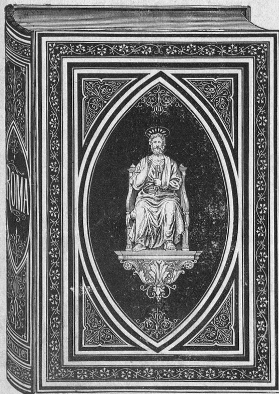
Verkleinerte Abbildung der Einbanddecke zu „Roma“.

Zu Festgeschenken geeignete Prachtwerke.