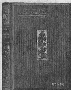
Verkleinerte Abbildung der Einbanddecke.