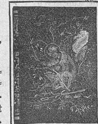
Einband 118 d.

Verlag von Benziger & Co., Einsiedeln und Waldshut.