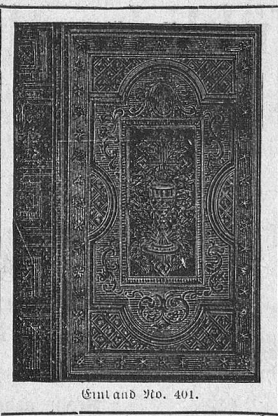
Einband No. 401.

des bitteren Leidens und Sterbens unseres Herrn Jesus Christus. Nebst vollständigem Gebetbuch. Von P. Martin von Cochem. Mit 4 Bildern. 400 Seiten. Format XII. 153x95 mm. Einband No. 302. Englische Leinwand, Rotschnitt . . . . . Mk. 1. 20