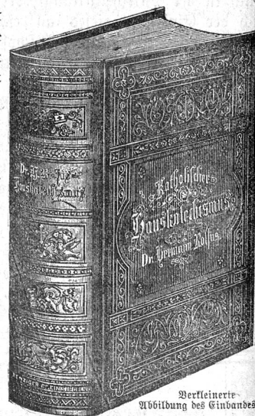
Verfeinerte Abbildung des Einbandes.

Der erprobte Name des Autors läßt etwas Gediegenes erwarten. Die Darstellung der christlichen Lehre ist einfach, populär und anziehend; der Inhalt reichhaltig und praktisch. . . Der weitesten Verbreitung empfohlen.