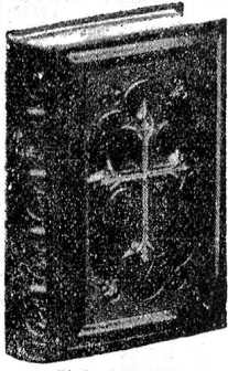
Einband No. 411.