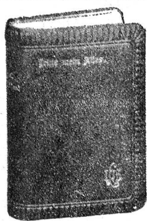
Einband No. 645

Mit Chromofibel und 2 Chromobildern. 440 Seiten. Sormat V. 108×66 mm.