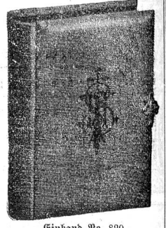
Einband No. 820.

Mit Chromo-Zierfibel und 1 Stahlstich. 480 Seiten. Sormat V. 108×66 mm.