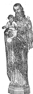
Räber & Cie., Buch- und Kunsthandlung, Luzern.

Eine tüchtige, in allen Haushalten erfahrene Person, welche gut empfohlen wird, sucht Haushälterin-Stelle in ein Pfarrhaus. Auskunft bei der Exp. der Kirchenz.