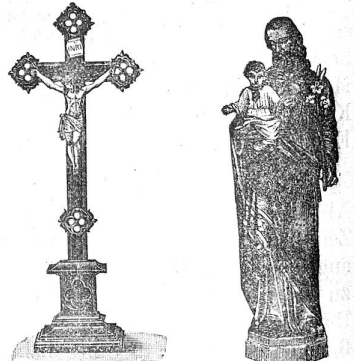
Räber & Cie., Buch- und Kunsthandlung, Luzern.