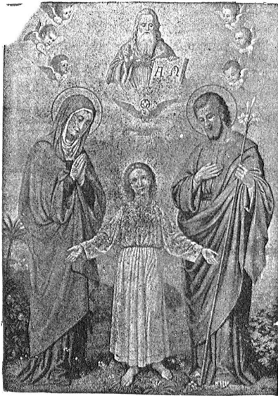
Die heilige Familie.

Wir bringen folgende Formulare für den Verein der christlichen Familie in freundliche Erinnerung: