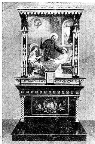
Altar ausgeführt für die Kapelle der Apotheke des Vatikans, Rom 1929.

Spezialschule für Englisch „Rapid“ in Luzern Nr. 133 Prospekte gegen Rückporto.