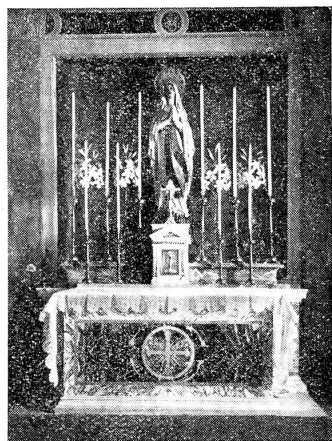
Ausgeführt für den Vatikan 1925