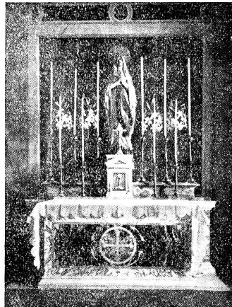
Ausgeführt für den Vatikan 1925