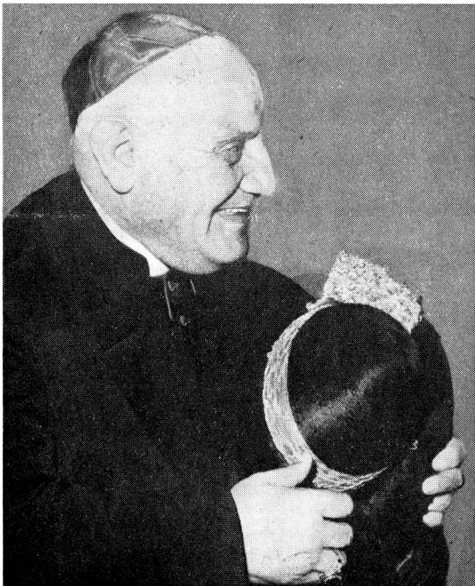
Kardinal Angelo Roncalli trifft zur Papstwahl in der Vatikanstadt ein.

Kardinal Angelo Roncalli besteigt als Papst Johannes XXIII. den Stuhl Petri